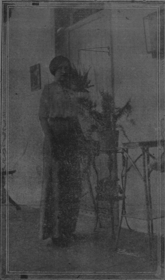
Instantánea tomada ayer por uno de nuestros redactores.