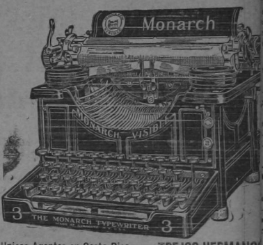
Unicos Agentes en Costa Rica - 2883-8 rb. TREJOS HERMANOS